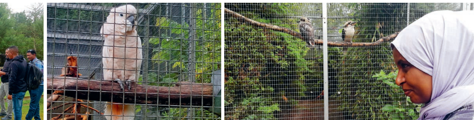
Nordsjællands Fuglepark har mere end 2.000 fugle fra hele verden.