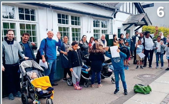
Frivilliggruppen i Borup genåbnede i juli måned med en pragtfuld tur til Zoologisk Have.