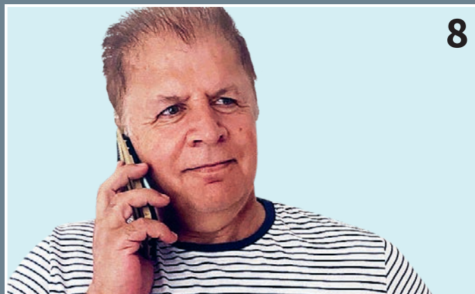
Khatan, som bor i Aarhus, har fået en telefonven, som på modersmålet forklarer de ting, han har svært ved at forstå.