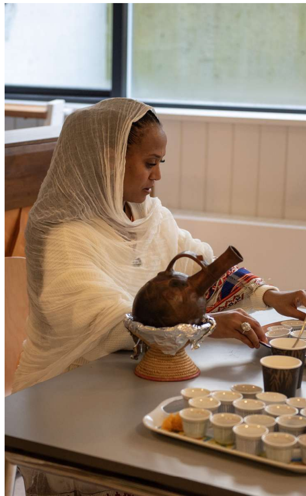
Ruta laver traditionel eritreisk kaffe.

Gennem støtte fra Mødrehjælpen, Diversity Works, Frelsens Hær og Dansk Flygtningehjælp fik hun netværkspersoner og mulighed for at møde andre mennesker.