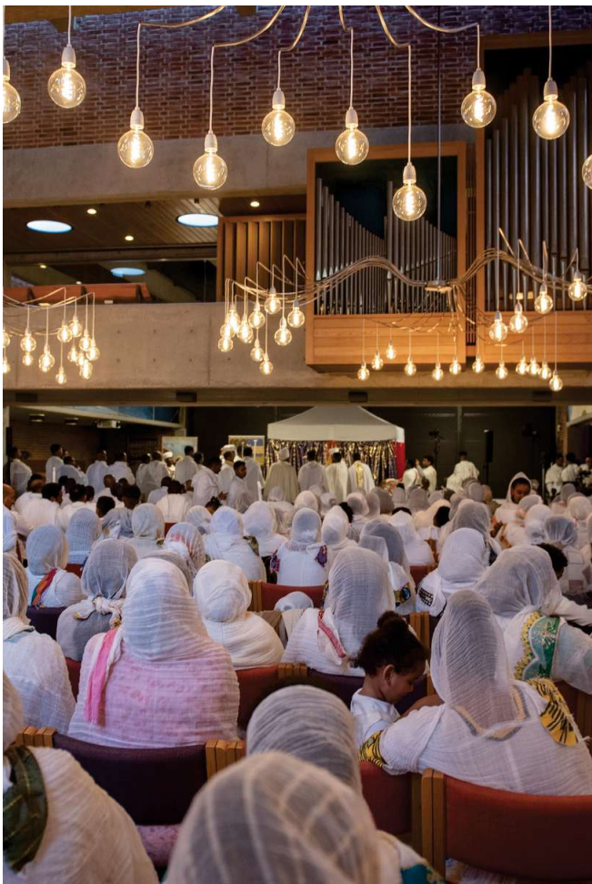
Over 500 mennesker med eritreiske baggrund var samlet fra hele Danmark til fejring af Sankt Michaelsdag.