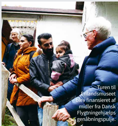
Turen til Frilandsmuseet blev finansieret af midler fra Dansk Flygtningehjælps genåbningspulje.